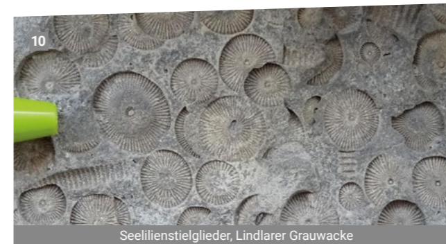
Seelilienstielglieder, Lindlarer Grauwacke