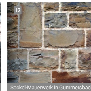
Sockel-Mauerwerk in Gummersbach