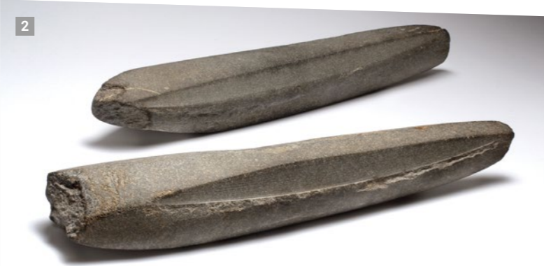
Unfertiges Felsgesteingerät aus Grauwacke, jungsteinzeitlich, Vollersroda

Doch wie es zu diesen unsortierten Sedimentgesteinen kam, deren schlecht gerundete Klasten in eine sehr feste, feinkörnige Matrix eingebettet sind, war lange ein geologisches Rätsel. Der eigentliche Ablagerungsprozess wurde erst im letzten Jahrhundert entdeckt.