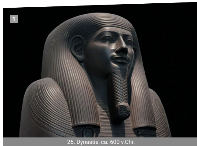
26. Dynastie, ca. 600 v.Chr.

Grauwacke bezeichnet einen meist dunkelgrau bis braungrau gefärbten, dichten Sandstein, dessen Hauptkomponenten aus Quarz, Feldspat und Gesteinsbruchstücken wie z. B. Vulkaniten, Lydit und Quarzit bestehen. Weitere Gemengteile sind Glimmer, Chlorit und Tonminerale. Das Gefüge ist fein- bis grobkörnig, mitunter auch feinkonglomeratisch. Typisch für Grauwacken ist eine schlechte Sortierung des Korns. Ebenfalls typisch ist ihre hohe Festigkeit, die sowohl aus einer geringen Porosität von meist weniger als 5 % als auch einer intensiven Bindung der Klasten resultiert.