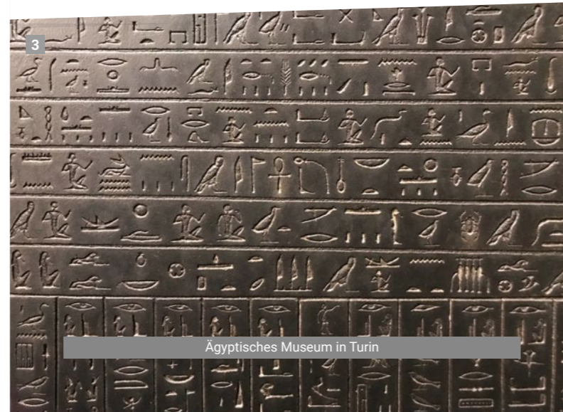
Ägyptisches Museum in Turin