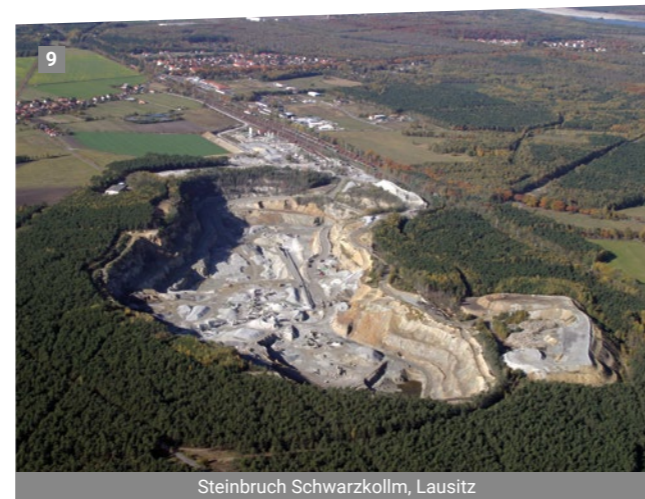
Steinbruch Schwarzkollm, Lausitz

Weltweit bedeutende Vorkommen befinden sich in den Ostalpen in Österreich, in verschiedenen Regionen der Britischen Inseln, in Ägypten sowie in den neuseeländischen Südalpen.