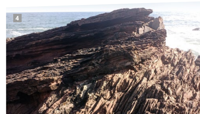
Siccar Point – Unterdevon Sandstein auf Untersilurischer Grauwacke

In den 1950er Jahren untersuchten Geowissenschaftler im Nordatlantik eine Serie von Brüchen transatlantischer Telefonkabel, die sich 1929 ereigneten und offensichtlich mit einem Erdbeben vor der Küste Neufundlands in Zusammenhang standen. Diese Brüche waren an Stellen ausschließlich am Kontinentalhang und auf der unterhalb gelegenen Tiefsee-Ebene, aber nicht auf dem höhergelegenen Kontinentschelf aufgetreten. Die exakt gemessenen Zeitpunkte der Bruchereignisse konnten schließlich damit erklärt werden, dass durch das Erdbeben eine große Masse an Ton und Sand ins Rutschen geraten war, die als Trübestrom (vergleichbar mit einem Schlammstrom unter Wasser) den Kontinentalhang hinabglitt und die Kabel zerriss. Diese Trübestrome bewegen sich mit einer Geschwindigkeit von bis zu 70 km/h und können dabei mehr als 100 km zurücklegen. Die Wissenschaftler entnahmen im fächerförmigen Ablagerungsgebiet Gesteinsproben und entdeckten genau die gleichen Merkmale wie sie aus Grauwacken bekannt waren. So wurde ein jahrhundertealtes Geologie-Rätsel gelöst!