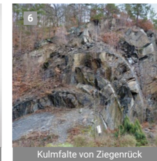
Kulmfalte von Ziegenrück