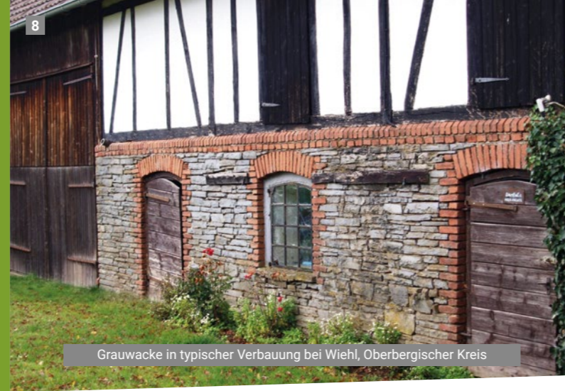
Grauwacke in typischer Verbauung bei Wiehl, Oberbergischer Kreis

Weitere Informationen unter www.gestein-des-jahres.de