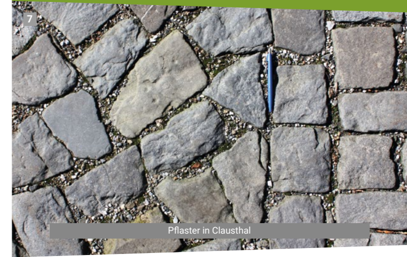
Pflaster in Clausthal